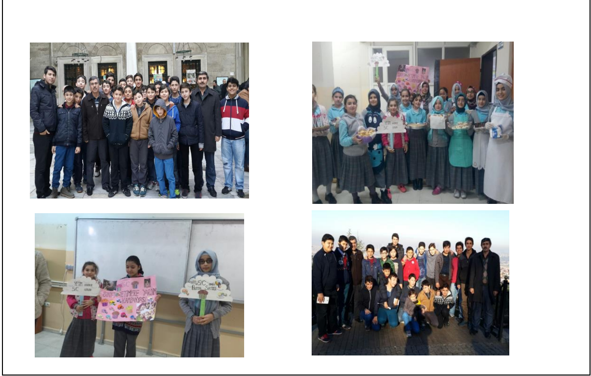
Tablo-6 – Faaliyet Alanları ve Sunulan Hizmetler Tablosu